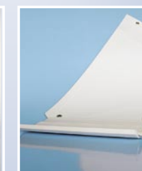
ISOLA com dispositivo de orla laminar dianteira