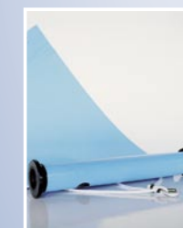
ISOLA com dispositivo de fixação

Manutenção: limpeza ocasional, fora disso manutenção desnecessária