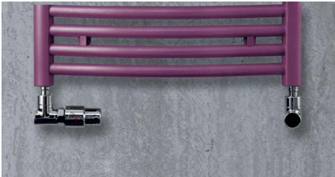
Ejecución para funcionamiento con agua caliente con conexiones a derecha, izquierda.