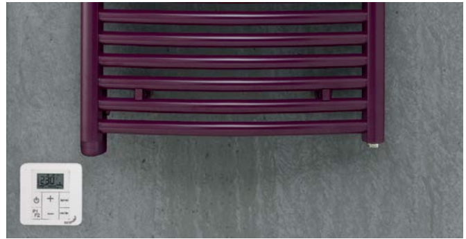
Modelo para funcionamiento eléctrico con resistencia eléctrica integrada.

V20180815, RAD_DAS, ES_es, sujeto a cambios