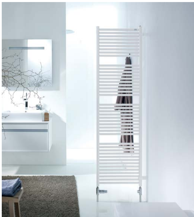
Ejecución con juego de montaje de separadores de ambientes opcional