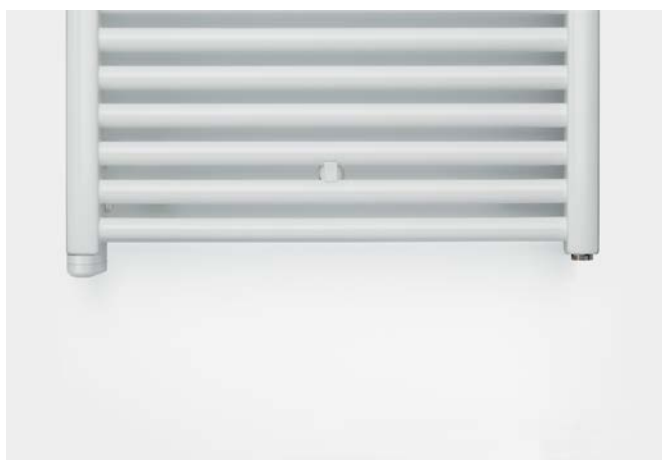
Modelo para funcionamiento eléctrico con resistencia eléctrica integrada.