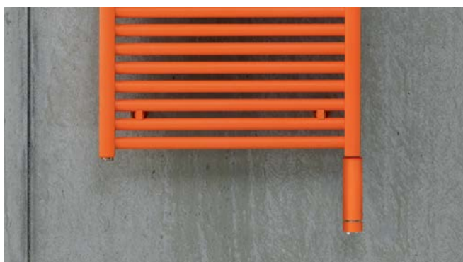
Electric operation version with integrated immersion heater WIVAR II.

V20180814, RAD_DAS, ES_es, sujeto a cambios