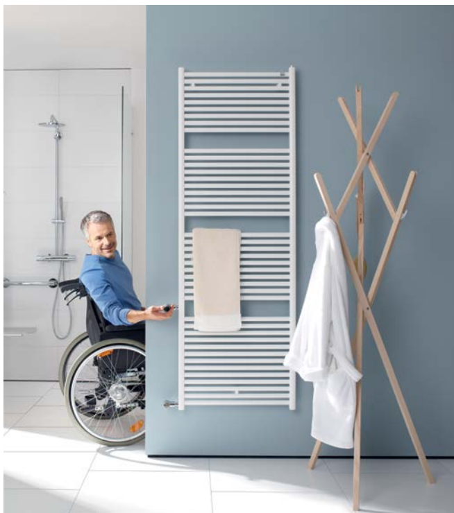
Modelo de sustitución con manejo lateral para espacios sin barreras