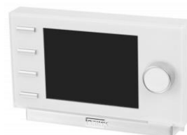
Programação e Controlo Avançado: Air Control Brink